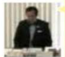
議会常任委員会の様子 厚生産業委員会委員長に就かせて頂いております。