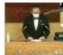
議会一般質問の議場