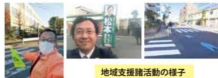
地域支援諸活動の様子