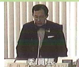
12月議会の様子 厚生産業委員会委員長 に 就かせて頂いております。