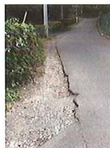
農業試験場内段丘の整備 (U字溝敷設、舗装打替等)