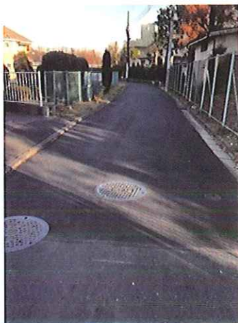
富士見町団地際 生活道路の改善